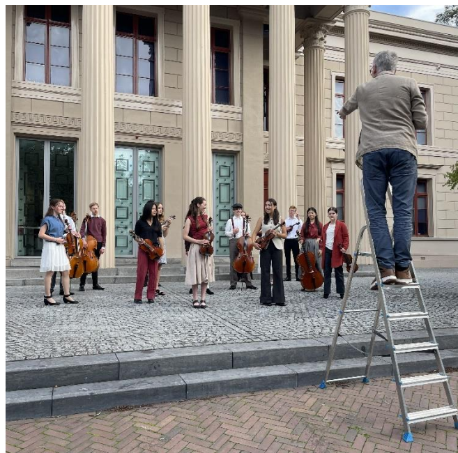
Fotoshoot 2025 bij Museum de Fundatie