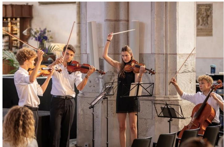
Het Britten Strijkkwartet in actie

https://www.linkedin.com/company/hetbritten/