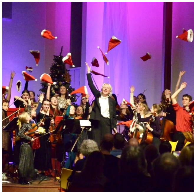
Kerstconcert met alle Britten orkesten gezamenlijk 'op de planken'