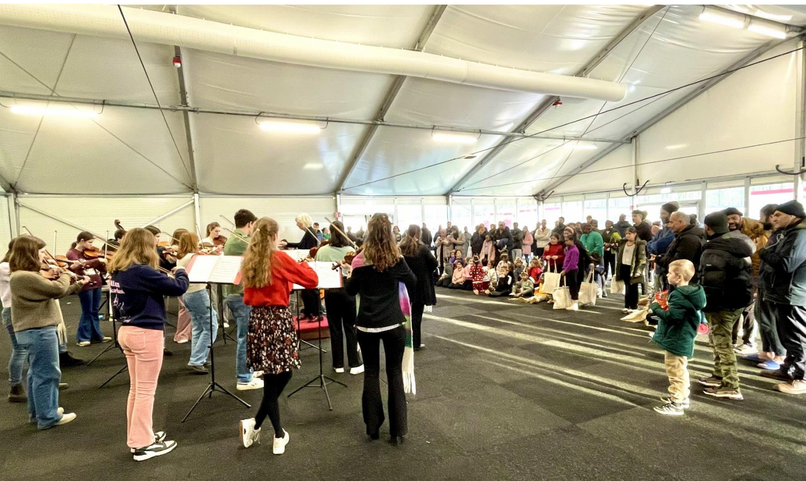
Pop-up concerten in het AZC in Biddinghuizen

De stichting ziet muziekeducatie nadrukkelijk als maatschappelijke opdracht en wil bijdragen aan gelijke kansen voor jong talent.