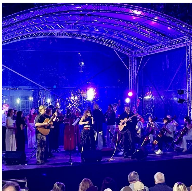
Cross-over tijdens de opening van de Passarelle in Zwolle

De stichting ziet samenwerking nadrukkelijk als noodzakelijke voorwaarde voor een gezonde infrastructuur voor talentontwikkeling in Noord/Oost-Nederland.