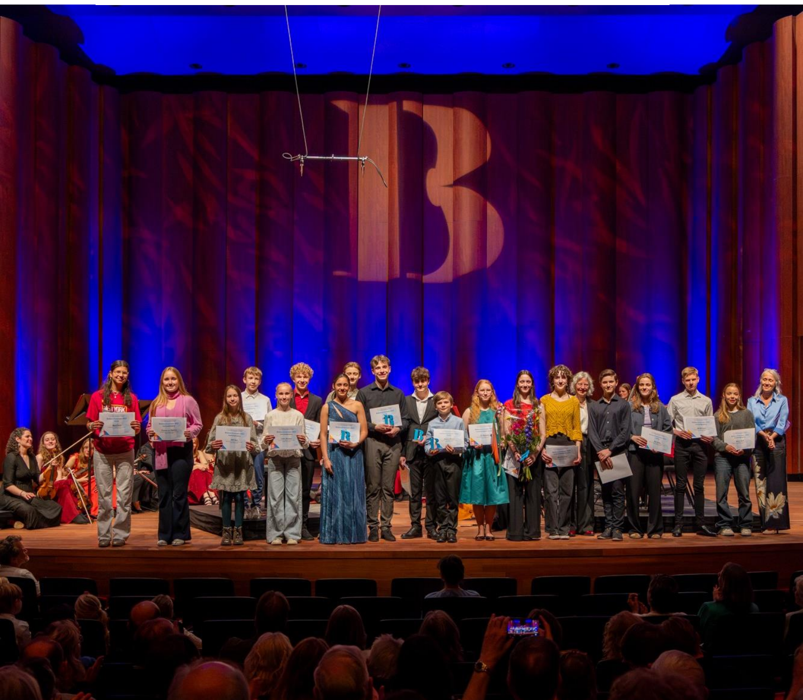
Prijsuitreiking van het Britten Concours

Tegelijkertijd laat de jaarrekening zien dat de stichting erin is geslaagd een omvangrijk activiteitenprogramma te realiseren binnen een beheersbaar kostenkader. De subsidiebasis en de publieke belangstelling bieden vertrouwen voor de toekomst.