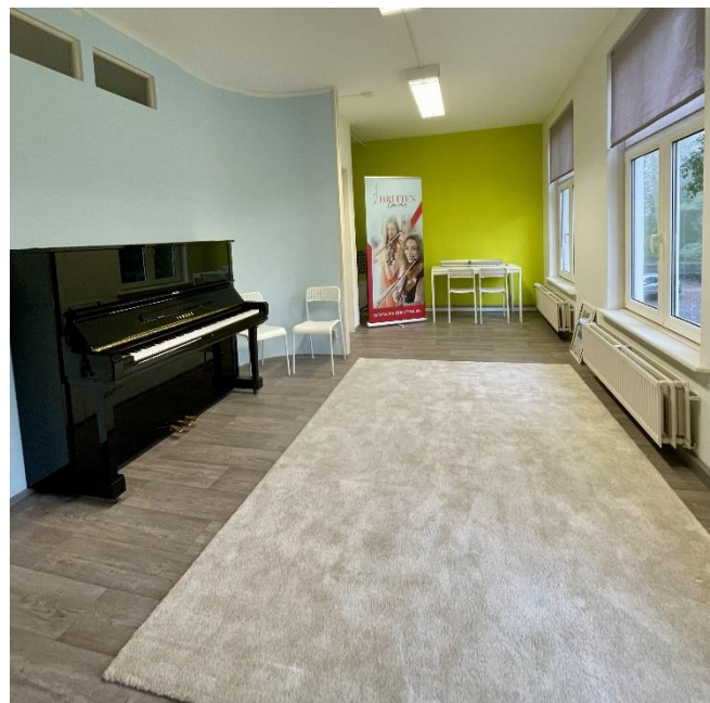
Eigen repetitieruimtes in hartje Zwolle