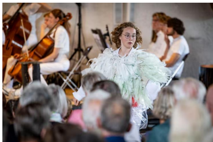
Community Art met Noeh's Fludde van Benjamin Britten tijdens het Stift Festival