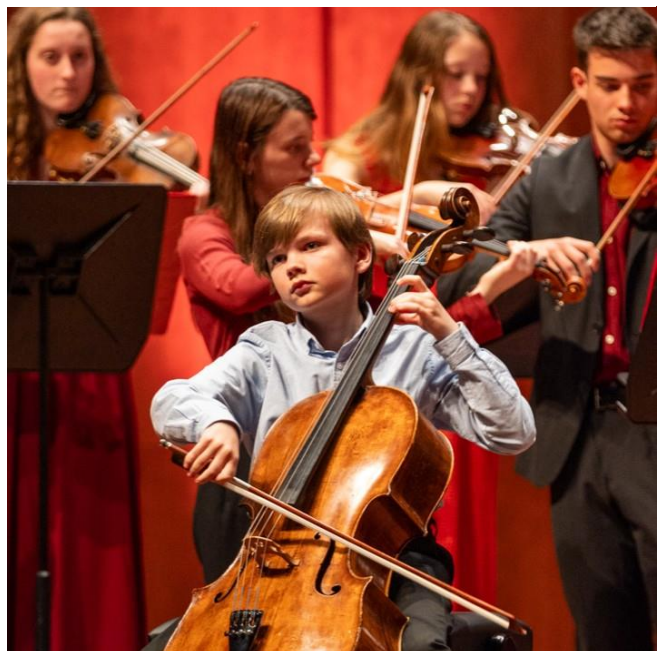
Jong talent als solist met het Britten Jeugd Strijkorkest