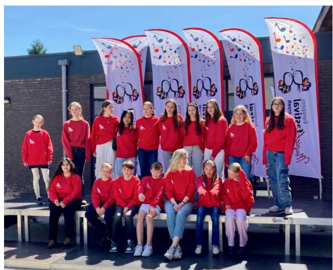
Benjamin Jeugd Strijkorkest op tournee in Neerpelt, België

De stichting blijft het van groot belang vinden dat jonge musici podiumervaring opdoen op uiteenlopende